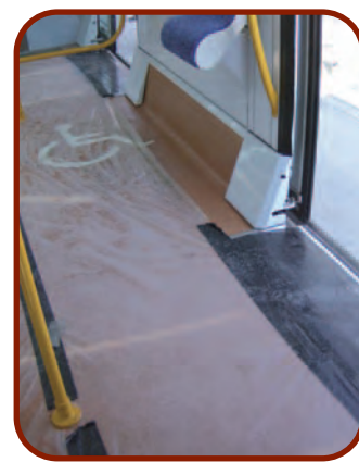
Zona reservada a personas con movilidad reducida