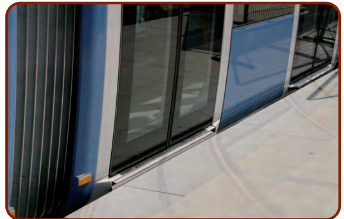
Puertas al mismo nivel que el andén, lo que facilita el acceso