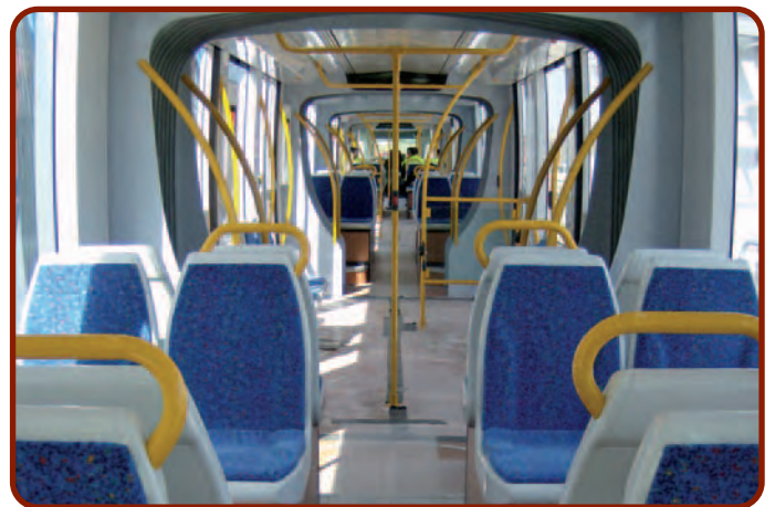
Interior de los vagones, con barras de sujeción amarillas, para una mejor visualización por parte de las personas con dificultades visuales