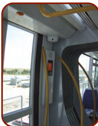
Llamada de emergencia y cámara de control

Durante el trayecto, el usuario puede viajar sentado o de pie, dispone de información a bordo de los trenes (planos de línea, información práctica) y de información sonora que le indica el nombre de cada parada. Es importante que los viajeros se sujeten al viajar de pie, pues aunque el Metro Ligero es muy suave en su funcionamiento, en caso de emergencia podría frenar y es muy importante estar siempre sujeto para evitar cualquier caída a bordo. Como norma de civismo y seguridad, se solicita ceder las plazas sentadas a las personas mayores, mujeres embarazadas, personas con alguna discapacidad o padres con niños de corta edad.