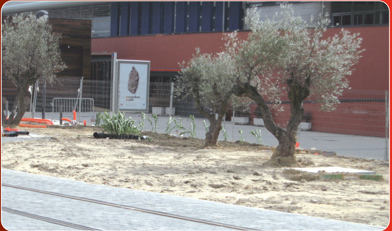
Una de las zonas acondicionadas a lo largo del recorrido en la Ciudad de la Imagen