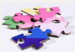
Creación de puzzles