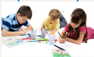
Mural de arte