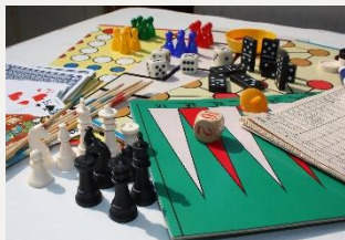
Juegos de mesa