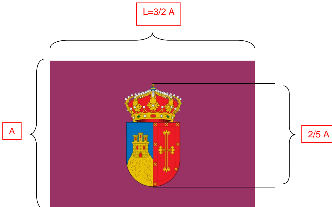
Figura nº 2. Bandera de la Villa de Pozuelo de Alarcón y sus proporciones.

La representación gráfica de la bandera de la Villa de Pozuelo de Alarcón, conforme a lo establecido en el presente artículo, se atenderá a lo especificado en la figura nº 2.