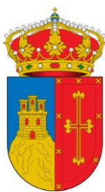
Figura nº 1. Escudo heráldico municipal de la Villa de Pozuelo de Alarcón.

La representación gráfica del Escudo heráldico municipal de la Villa de Pozuelo de Alarcón, conforme a lo determinado en el artículo 9, se atenderá a lo especificado en la figura nº 1.